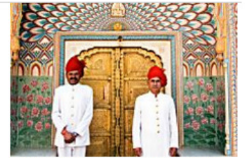
Where are the most majestic and flamboyant palaces hiding in India? Marie France