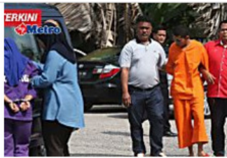
Remaja OKU, wanita didakwa bunuh