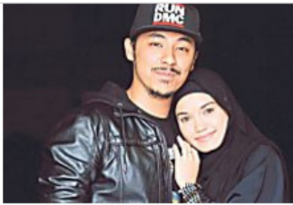
Ibu mentua beri semangat