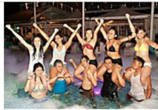
A sneak Peek into the lives of Internet millionaires: how they make money will shock you! 24 Business News